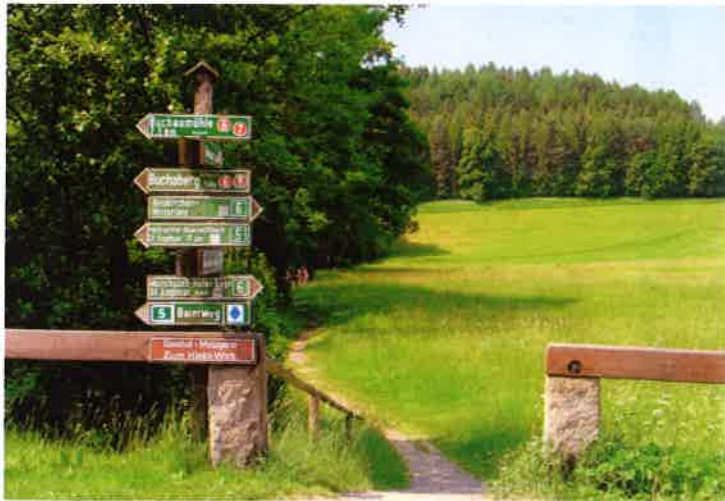
Gemeindefalkung: Beck, Straubing, www.beck-ar.de - Fotos: Verlag Beck, Jueland

Auskunft: Rathaus / Touristinfo Hauptstraße 2 • 94362 Neukirchen Tel. 09961/910210 • Fax 09961/910212 info@neukirchen.net • www.neukirchen.net