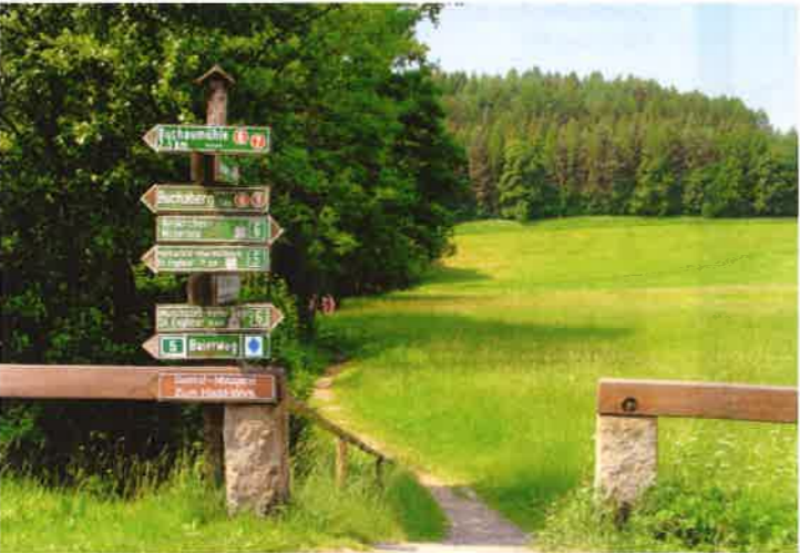
Gesamtherstellung: Beck, Straubing, www.beck-sr.de

Auskunft: Rathaus / Touristinfo Hauptstraße 2 · 94362 Neukirchen Tel. 09961/910210 · Fax 09961/910212 info@neukirchen.net · www.neukirchen.net